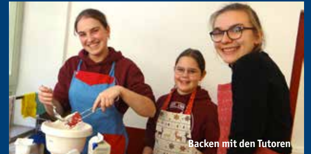
Backen mit den Tutoren