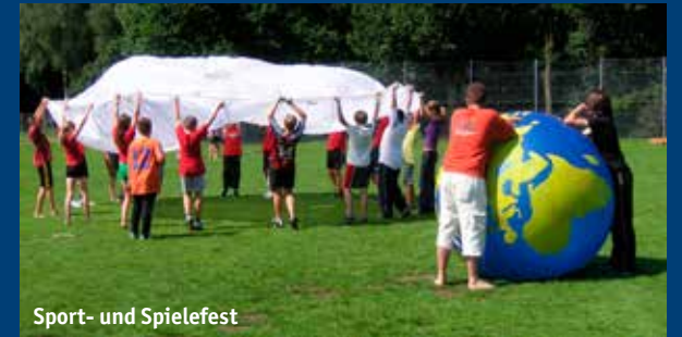
Sport- und Spielefest